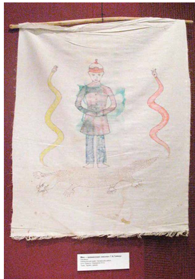
Мио – шаманская икона Г.К. Гейкер

Привлекая материалы по шаманизму у других народов Сибири и Дальнего Востока, этнограф анализирует представления нанайцев и ульчей о мире, дает развернутую картину мира духов, приводит важные сведения о таком понятии, как «душа человека». Впервые в науке подробно описаны обряды посвящения шаманов, зафиксированы и проанализированы типы и образцы камланий, приведена подробная