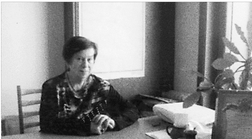
В рабочем кабинете отдела Кавказа ИЭА РАН