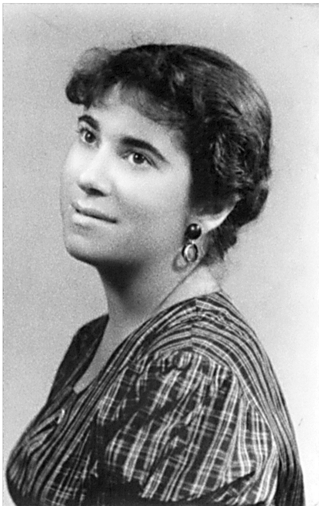
В молодые годы