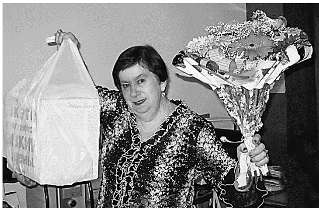
Юбилей – 70-летие. Апрель, 2007 г.