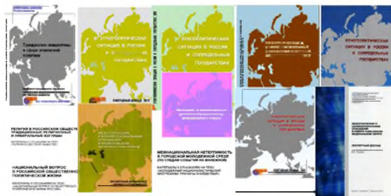
Рис. 9. Экспертные доклады (рисунок автора, 2014 г.)

В 1993 г. на базе института создана Сеть этнологического мониторинга и раннего предупреждения конфликтов, в которой сотрудничают ведущие эксперты из различных регионов России. Этномониторинг занимается сбором и анализом данных, характеризующих состояние межэтнических отношений, политическую активность этнополитических организаций, деятельность органов власти в области этнонациональной политики. В сферу его интересов входит изучение этнополитической ситуации в постсоветских странах, разработка мер по предупреждению и урегулированию конфликтов. Системный анализ различных показателей позволяет выявлять и отслеживать проблемные ситуации еще на стадии их зарождения, а в случае открытого конфликта – не допускать его эскалации.