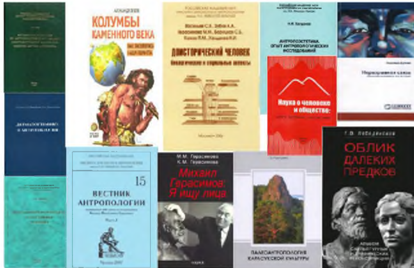
Рис. 13. Труды по физической антропологии (рисунок автора, 2014 г.)

на территории нашей страны (Северный Кавказ, Поволжье, Прибайкалье), но и за ее пределами (Туркменистан, Египет). Наряду с традиционными направлениями в физической антропологии, появились и новые: антропогенетика, антропоэстетика и др. Антропоэстетика, кстати, находит применение в рекламном бизнесе (Физическая антропология).