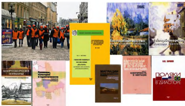
Рис. 3. Миграции и пограничье культур – актуальные темы исследования (рисунок автора, 2014 г.)

В разработках последних лет существенное внимание уделяется миграциям и адаптации русских в зонах позднего расселения, их социально-культурному статусу, трансформациям в историко-культурном развитии, этническим аспектам формирования новой гражданской идентичности. Заметный вклад внесен в комплексную разработку темы «Русские за рубежом» (Русские за рубежом). По заказу Министерства иностранных дел выполнялся проект «Российская диаспора в странах СНГ». Ученые института принимали участие в разработке рекомендаций Общественной Палаты Российской Федерации «Совершенствование миграционной политики в