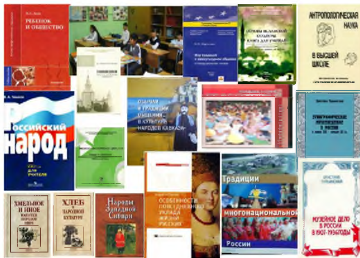
Рис. 16. Учебные пособия и популярные издания (рисунок автора, 2014 г.)

Многие сотрудники института занимаются преподавательской деятельностью. Большое внимание уделяется разработке методологических концепций и практических рекомендаций для повышения этнологической грамотности населения. Как госзаказ подготовлены информационно-просветительские пособия для мигрантов о повседневной культуре русских (Мартынова 2009) и для принимающей стороны – об особенностях повседневной культуры народов Кавказа (Обычай и традиции 2010).