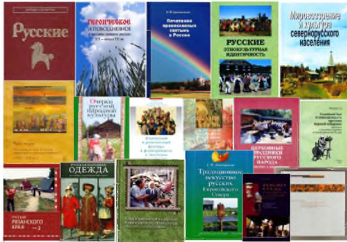
Рис. 2. Работы о культуре русского народа в 1993 г. удостоены Государственной премии РФ (рисунок автора, 2014 г.)

рая стала итогом многолетних экспедиционных, музейных и архивных исследований, проведенных сотрудниками института в Рязанском крае. В работах по русской проблематике важна тема православия и его роли в истории и культуре. В условиях политизированности этнической темы подобного рода фундаментальные труды имеют, в том числе и прикладное значение.