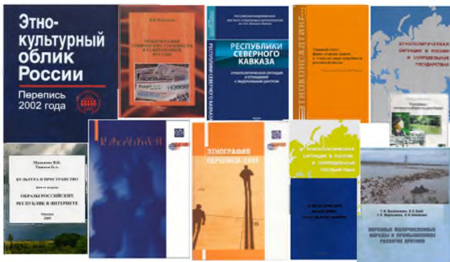
Рис. 10. Мониторинг и консалтинг (рисунок автора, 2014 г.)

урегулирования этнических конфликтов» (2013), «Этническая политика в странах Балтии» (2013), «Национальный вопрос в российской общественно-политической жизни» (2013), «Религия в российском обществе. Традиционные религиозные и либеральные взгляды» (2012), «Межэтнические и конфессиональные отношения в Южном федеральном округе» (2013), «Межэтнические и конфессиональные отношения в Северо-Кавказском федеральном округе» (2013), «Молодежь в полиэтничных регионах Приволжского федерального округа» (2013), «Межнациональная нетерпимость в городской молодежной среде (по следам событий на Манежной)» (2011) и др.