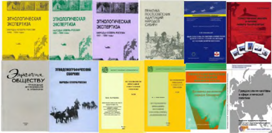
Рис. 8. Этнологическая экспертиза (рисунок автора, 2014 г.)

Значительное место в исследованиях российских этнологов принадлежит изучению идентичности, коллективных форм самоопределения, этнического представительства в системе властных отношений, а также таким явлениям, как ксенофобия, этнический и религиозный экстремизм (Этнополитика).