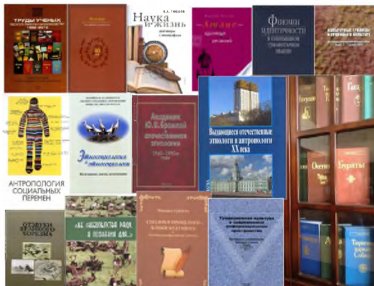
Рис. 1. История науки и преемственность поколений (рисунок автора, 2014 г.)

XIX века). И в те времена работы ученых были направлены на изучение «туземных народов» с целью выработки способов управления ими (Этнология обществу 2006). Сегодня тоже этнология / антропология помогает управлять обществом. Многие концептуальные наработки, хотя порой и критикуются, оказываются востребованы властью.