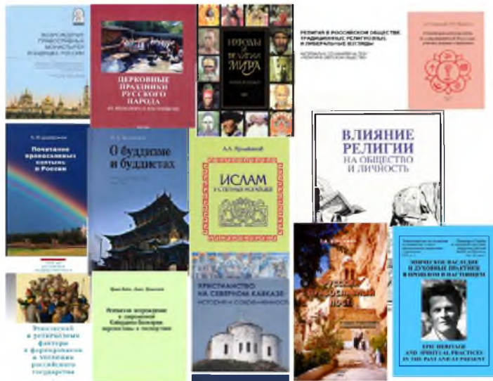
Рис. 15. Религиоведческая литература (рисунок автора, 2014 г.)

Еще раз подчеркну, что востребованным в научном и политическом отношениях остается религиоведение. В этой связи вновь отмечу, что фундаментальные этнологические исследования оказываются небеспольными для российских чиновников разного уровня. По заданию Общественной палаты РФ была оказана методическая помощь и экспертная оценка общероссийского социологического исследования для общественных слушаний на тему «Религия в светском обществе». Выполнен обстоятельный анализ религиозной ситуации в Москве, включая исследование малых конфессий, религиозных групп и направлений. Издана энциклопедия «Народы и религии мира» – уникальный справочник, в подготовке которого участвовали многие специалисты (Религиоведение).