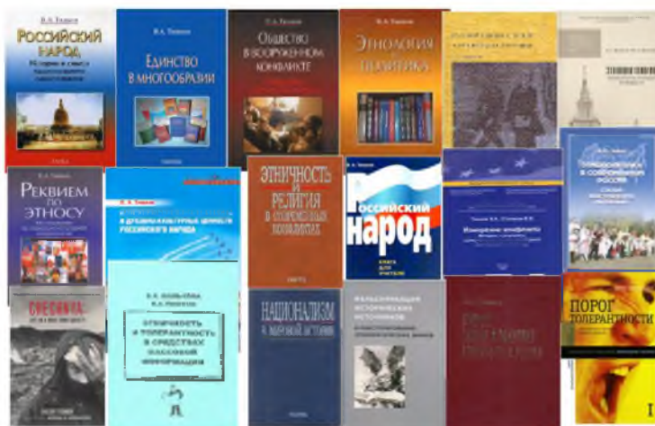
Рис. 7. Этнология и политика (рисунок автора, 2014 г.)

Примерно со второй половины 1980-х годов усилилось внимание к исследованию так называемых этнонациональных процессов, к этнополитической проблематике. Стало очевидным, что роль этнического фактора в политических процессах, а также в управлении многоэтничными государствами долгое время недооценивалась. Общественно-политические события последних десятилетий – «этническое возрождение», рост националистических движений, обострение межэтнических противоречий – обострили интерес к этнологическим знаниям, потребовали от ученых гибкой реакции на научные и общественные запросы. В связи с этим в работе российских этнологов был сделан акцент на изучение современных проблем общественной жизни России, таких, как рост этнического самосознания (этническая мобилизация) и формы национализма, причины сепаратизма и этнических конфликтов. Бесценной для последующих поколений исследователей можно считать серию «Национальные движения в СССР и на постсоветском пространстве», в 110 томах которой под руководством ее автора и ответственного редактора М.Н. Губогло печатались документы, собиравшиеся в различных регионах страны. М.Н. Губогло – также автор многочи-