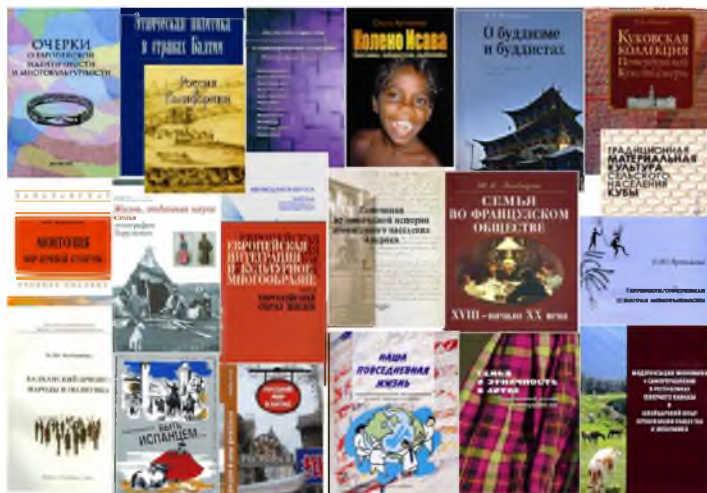
Рис. 6. Этнокультурный облик народов мира глазами ученых ИЭА РАН (рисунок автора, 2014 г.)

В работах кавказоведов особо значимо изучение современной этнополитической ситуации в регионе. В частности, проведен анализ текущих в Чечне процессов и были высказаны предложения по актуальным проблемам. Изучаются также традиционные институты и культурное наследие народов Кавказа, религиозная ситуация. Одним из механизмов нормализации ситуации воспринимается верность традиции, в которой видится спасение от глобализации. Вместе с тем многие стороны современной кавказской жизни подверглись за последнее время существенным изменениям, причем не только в сфере материального и хозяйственного быта, но и в области соционормативной культуры (Народы Кавказа). Дважды в месяц проводится весьма популярный научный семинар, посвященный проблемам Северного Кавказа.