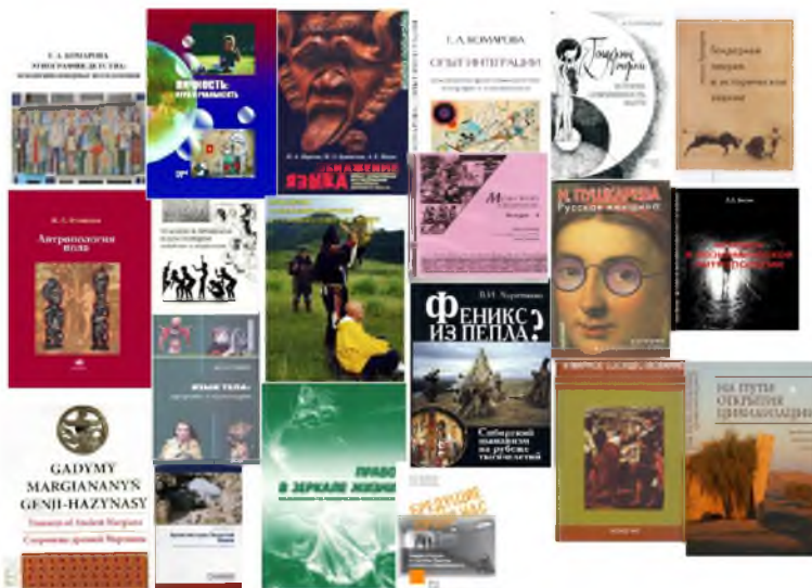
Рис. 14. Междисциплинарные исследования (рисунок автора, 2014 г.)

Проводящиеся в институте исследования включают такие междисциплинарные темы, как этносоциология (Этносоциология), этнодемография, этноэкология, этноархеология (Этноархеология), основы которых были заложены в 1960–1980 гг. Целый ряд направлений – гендерные исследования, юридическая антропология, аудиовизуальная антропология, кросс-культурная психология, экономическая антропология – возник относительно недавно.