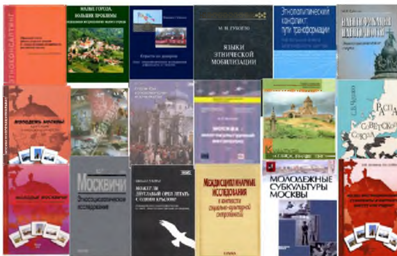
Рис. 11. Антропология социальных перемен (рисунок автора, 2014 г.)

Показателем востребованности науки для системы государственного управления может служить то, что аппарат Правительства РФ, Администрация Президента, различные министерства и ведомства, периодически объявляют конкурсы на выполнение тех или иных научных заданий прикладного характера. Ученые-этнологи являются руководителями и исполнителями многих такого рода проектов и программ.