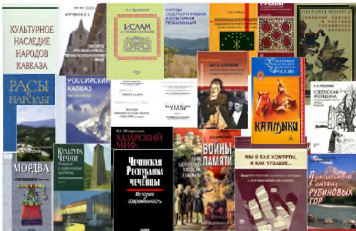
Рис. 5. Основные направления исследований по-прежнему определяются предметной сферой науки о народах (рисунок автора, 2014 г.)

дарственного патернационализма (Малочисленные народы Севера).