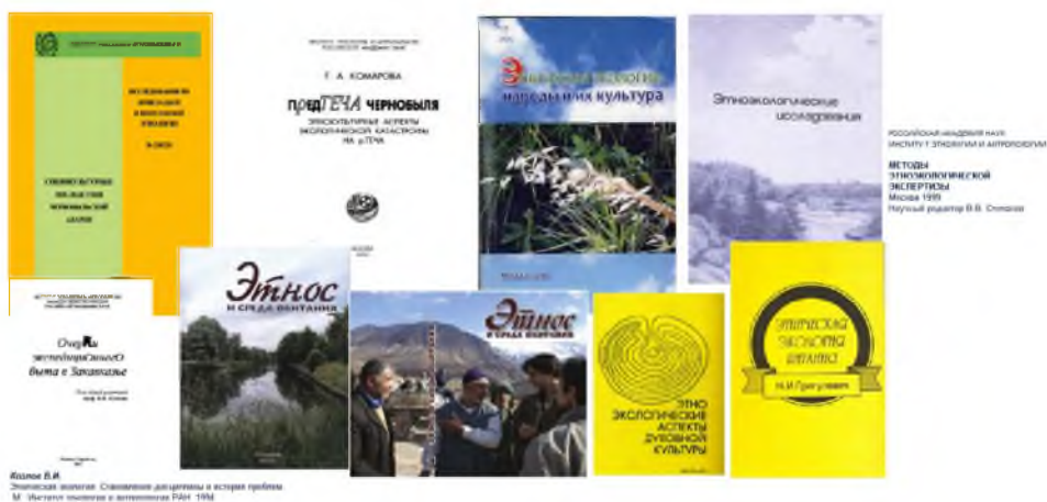
Рис. 12. Этноэкологические исследования (рисунок автора, 2014 г.)

Как представляется, огромное социальное и прикладное значение имеют этноэкологические (социально-экологические) исследования. Их возможности и перспективы в какой-то степени недооцениваются, и многие вопросы пока вне поля внимания. Тем не менее, социально-экологическая экспертиза довольно успешно развивается в нашей стране. Исследования по социальной экологии основываются на представлении о мире, как о единой и целостной системе, существующей в триаде общество-природа-хозяйство. В России это направление началось с изучения кавказских долгожителей. В 1980-е – 1990-е годы шла работа по проекту «Этническая экология переселенческих групп. Русские старожилы в Закавказье». Были исследованы процессы адаптации русского крестьянского населения, мигрировавшего сюда в прошлые века, к условиям жизни в Закавказье. Тематика работ была комплексной и включала в себя изучение демографических, медико-антропологических и психологических характеристик русских старожильческих групп, их брачных связей и семейной структуры, традиционной и современной систем питания, специфики расселения, особенностей поселений и жилищ, хозяйственной деятельности, духовной культуры и социальной структуры конфессиональных общин. Итогом многолетних наблюдений стала серия монографий и сборников, которые до сих пор пишутся по собранному в экспедициях материалам (Этноэкология).